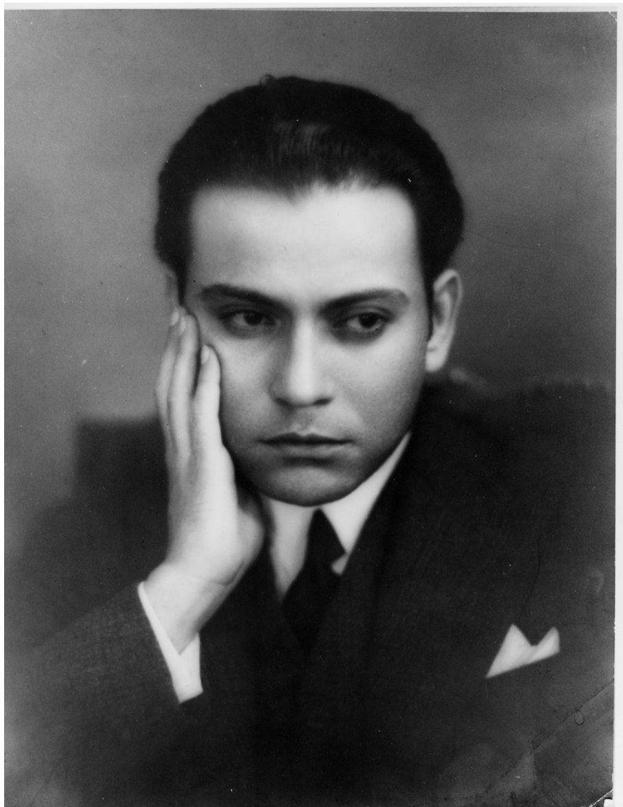
Ferreira de Castro Foto de San-Payo, cerca de 1930